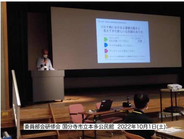
委員会研修会 国分寺市立本多公民館 2022年10月1日(土)